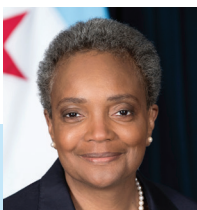
Lori E. Lightfoot Alcaldesa Ciudad de Chicago